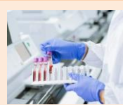
หมวด 07 Lab